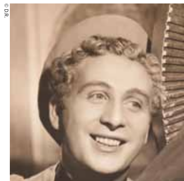
Documentaire de Karl Zéro et Daisy d'Errata (France, 2013, 52mn) - Coproduction : ARTE France, La Mondiale de Productions