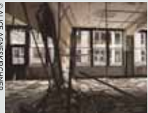
   ALICE AGNESKIRCHNER

17.05 HD +7 RUINES MODERNES Detroit : espoir pour une ville