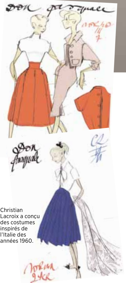
Christian Lacroix a conçu des costumes inspirés de l'Italie des années 1960.