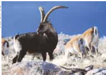
Série documentaire - Réalisation : Jens-Uwe Heins (Allemagne, 2010, 3x43mn) - (R. du 22/11/2010)