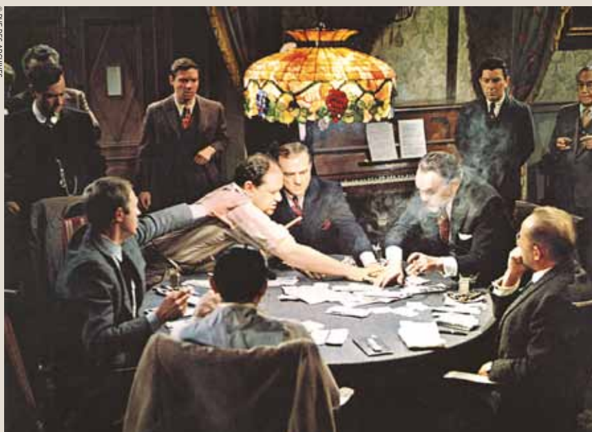
Le Kid de Cincinnati

Magazine présenté par Anthony Bellanger (France, 2012, 26mn)