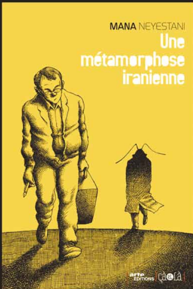
UNE METAMORPHOSE IRANIENNE - Un roman graphique de Mana Neyestani 17x24cm - 196 pp - ISBN : 978-2-916207-65-0

Bouleversant, Une Métamorphose iranienne est une plongée en apnée dans le système totalitaire kafkaïen mis en place par le régime iranien.