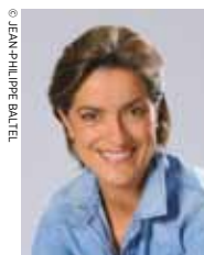
Présenté par Emilie Aubry

Documentaire d'Antoine Vitkine (France, 2014, 1h22mn) Coproduction : ARTE France, Roche Productions