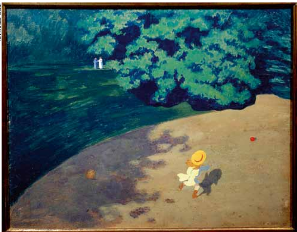
Le ballon de Félix Vallotton